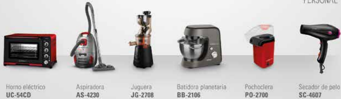
Horno eléctrico UC-54CD Aspiradora AS-4230 Juguera JG-2708 Batidora planetaria BB-2106 Pochoclera PO-2700 Secador de pelo SC-4607

COCCIÓN LIMPIEZA DESAYUNO COCINA FUN COOKING CUIDADO PERSONAL